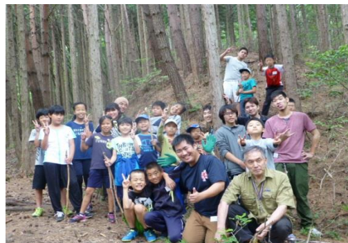
悪天候により、登山は入口付近まで