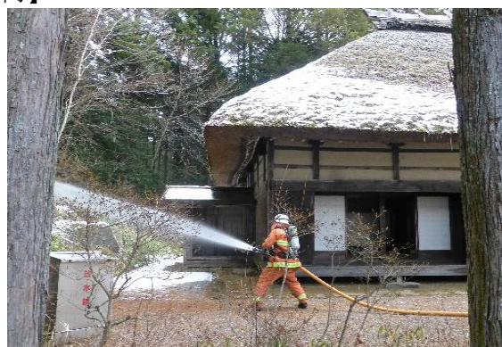
旧竹村家住宅 文化財防火デー