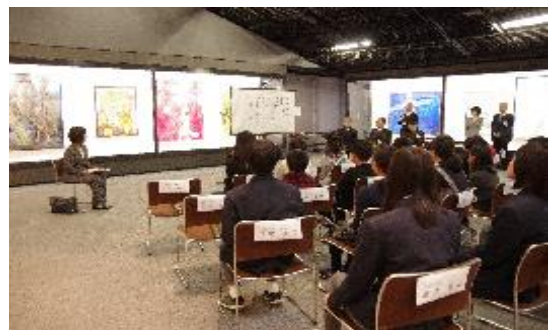
第3回「ジュニア駒展」市内小・中学生38名が入選