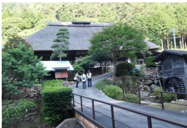
旧木下家住宅(中沢中山)