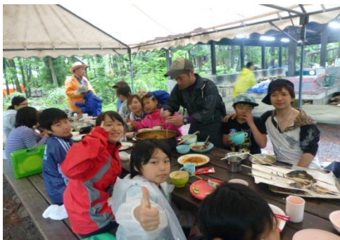
みんなで協力してつくった夕食