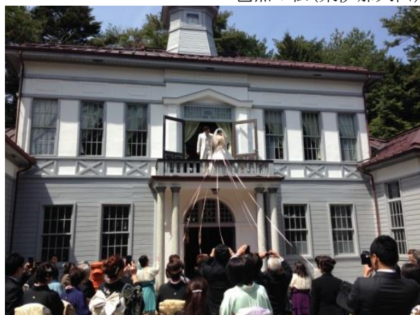
郷土館(菅の台) 駒ヶ根高原ブライダル協会