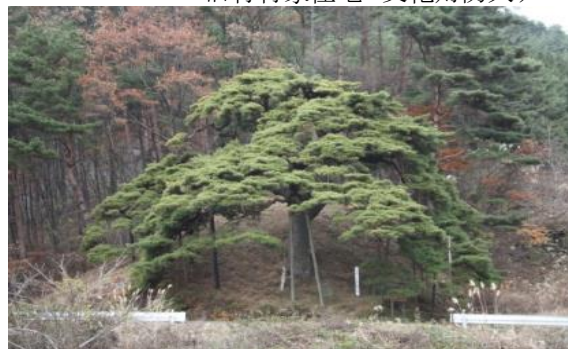
芭蕉の松(東伊那火山)