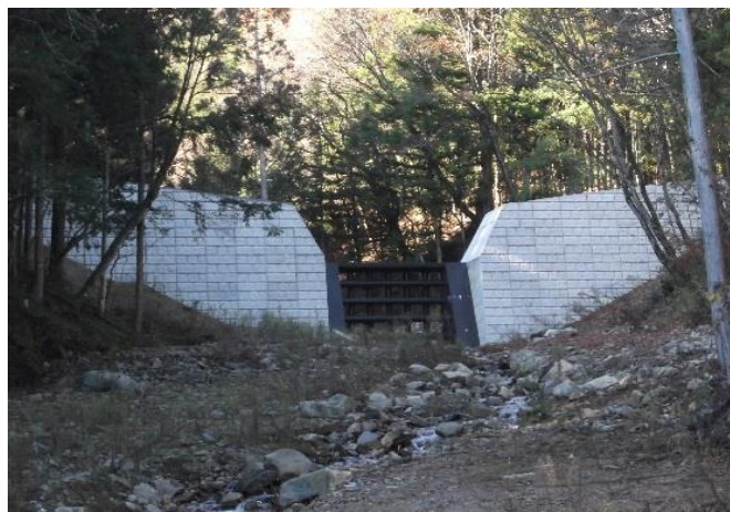
平成26年度完成した砂防えん堤 （上穂沢川）