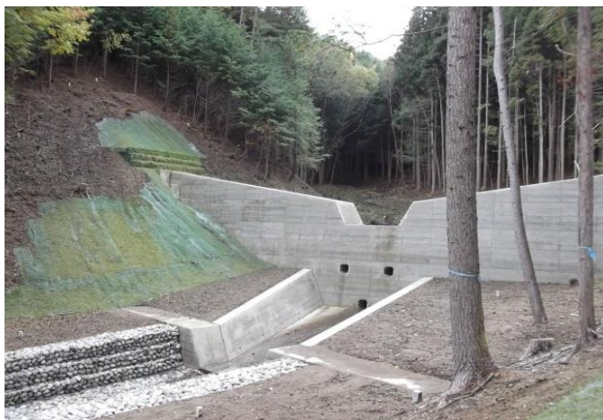
平成24年度完成した砂防えん堤 （下間川水系）