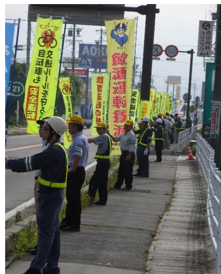
啓発活動「人波作戦」

啓発活動「人波作戦」の実施（春・夏・秋・年末の4回） 広報車からの交通安全の呼びかけ 有線放送・新聞による交通安全対策の推進 交通安全市民大会の開催（11月上旬予定） 交通事故危険箇所マップの作成 高齢者・園児への交通安全啓発