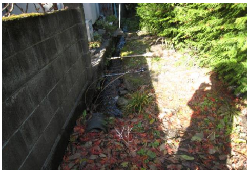
地域からの要望により用悪水路の整備を実施しました。

市街地内にある、未改修の水路を改修し、断面の確保と流下能力の確保を図っていきます。