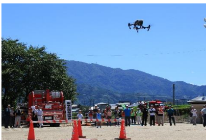
<駒ヶ根市地震総合防災訓練の様子(H30年度)>