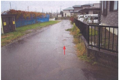
地域からの要望により道路側溝を整備し、水たまり対策を実施しました。

宅地化が進んだにも関わらず、側溝整備など排水路整備が遅れているところの、新設整備を推進します。