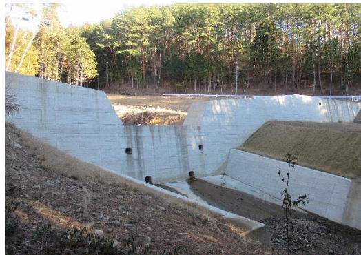
唐沢川砂防事業1号えん堤 （平成31年1月時点）