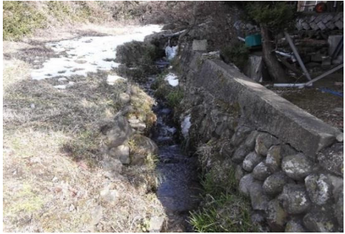
地域からの要望により河川の整備を実施しました。

駒ヶ根市が管理する河川の、護岸改良や護岸修繕を行い安全な河川施設の整備や維持管理を推進します。