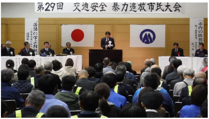
【交通安全・暴力追放市民大会】