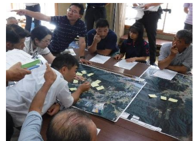
<住民主導型警戒避難体制構築事業>