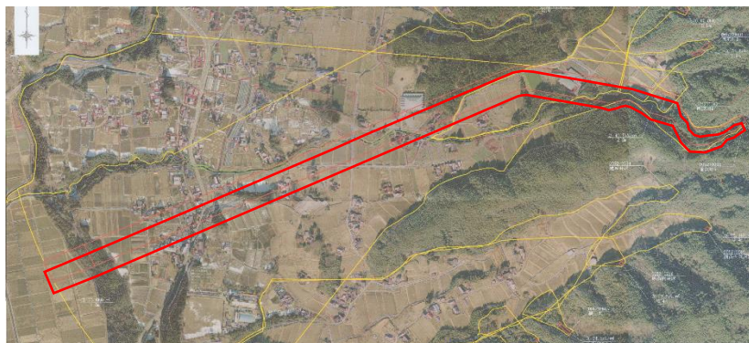
土砂災害警戒区域（唐沢川）