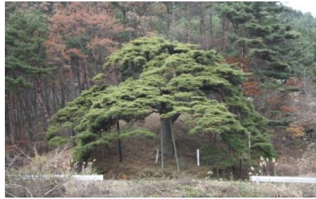
芭蕉の松 (東伊那 火山)