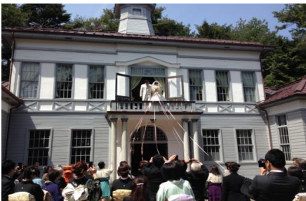
郷土館（菅の台） 駒ヶ根高原ブライダル協会