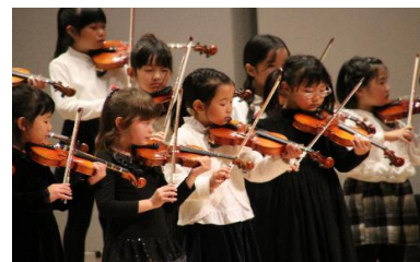
駒ヶ根子どもオーケストラ

駒ヶ根市文化財団に指定管理を委託し天竜かっぱ広場運営を実施 ふれあい講座、ミニほっと講座、歴史講座の開催 館収蔵資料・作品による企画展示の開催 竜東地域活性化への協力 施設管理