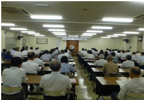
人権教育推進協議会 研修会