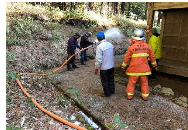
旧竹村家住宅 文化財防火デー 消火訓練の様子