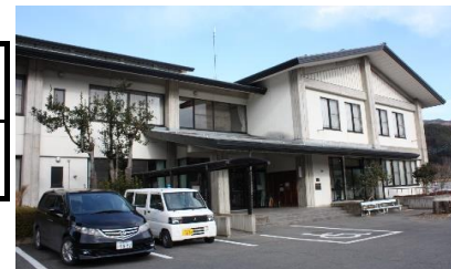
<中沢子どもクラブ（中沢公民館）>