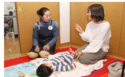
<ファミリーサポートセンター事業による託児>