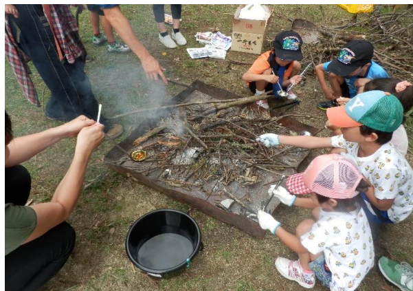
<焚き火体験(べっこう飴づくりなど)>