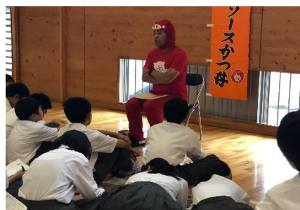
キャリア教育(アントレプレナー)