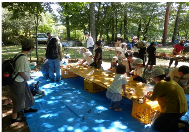
<大人気の木工体験>

※プレーパークは、子どもたちが「やってみたい」と思うことを、なるべく自分の力で実現するための自由な遊び場です。たとえば、木登りや工作、水遊び・泥んこ遊びに焚き火もできる環境など、自然の中で体を使って、様々な体験をしながら思いっきり遊ぶことを目的とします。