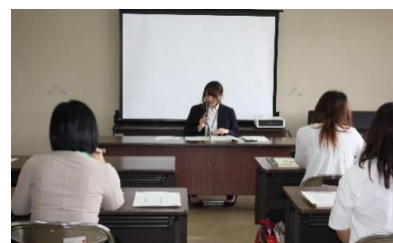
<子育てサポーター養成講座の各講義(7日間・全26時間)>