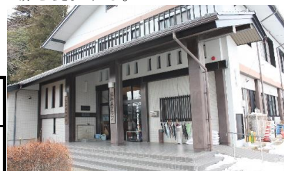
<土曜日も拠点として開館する三和森子ども交流センター>