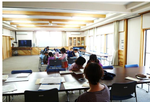
<子どもの居場所づくり>

いきいき交流センター等を活用した子どもの居場所づくりを継続して実施するとともに、助産師や保健師を派遣して、身近なところで相談できる体制を整備し、子育て支援体制を充実させる。