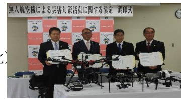
ドローンによる災害対策活動に関する協定

長野県防災情報システムの活用 雨量観測システム整備(Web)による監視体制の強化 防災業務支援サービスの活用(降雨期の気象情報入手の多様化) 国・県の災害情報(ホットラインとホームページ) J-ALERT新型受信機更新(情報伝達の迅速化)