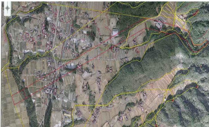
土砂災害警戒区域（唐沢川）