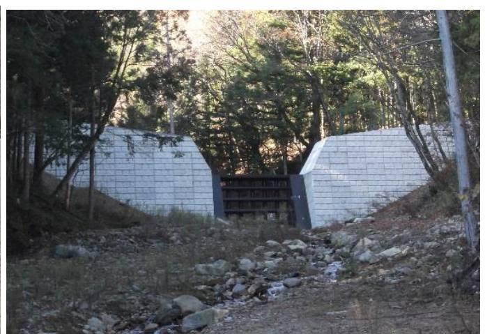
平成26年度完成した砂防えん堤 （上穂沢川）