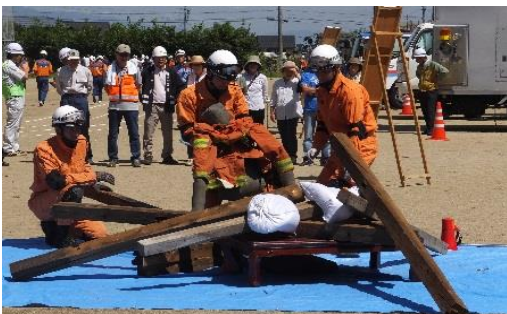
< 駒ヶ根市地震総合防災訓練の様子(H29年度) >