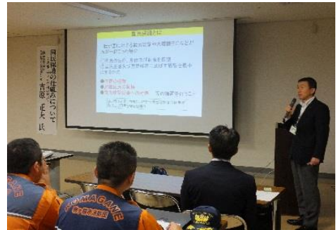
< 国民保護講演会 >