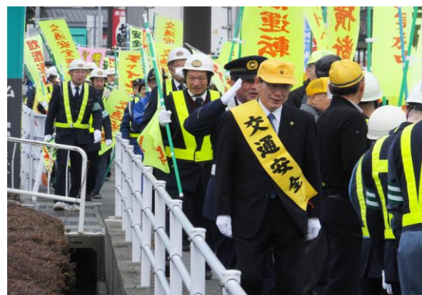
啓発活動「人波作戦」