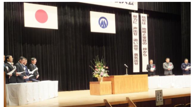
交通安全・暴力追放市民大会

駒ヶ根市防犯協会の活動 区ごとの巡回による危険箇所の点検 防犯指導員による青色パトロールの実施 祭礼、イベント会場におけるパトロール 季節ごとの街頭啓発活動