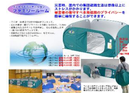
<ワンタッチパーテーション>