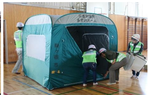
< 避難所設営訓練 >