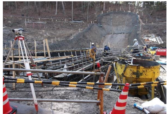
砂防えん堤建設状況（唐沢川）