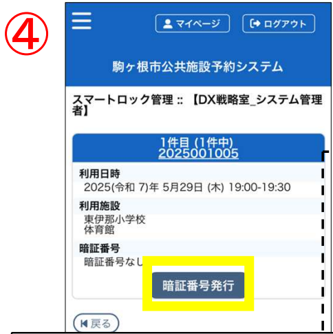
「暗証番号発行」を押す

※予約情報が表示されない場合 管理者の審査が未完了です。 「施設予約審査結果のお知らせ」メールを受信後に発行可能となります。