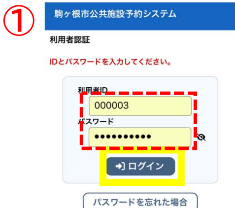
「駒ヶ根市公共施設予約システム」を開き、利用者IDとパスワードを入力してログイン