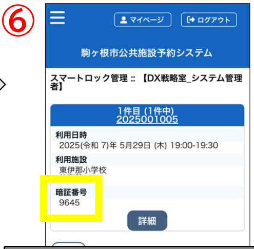
表示された暗証番号で開錠