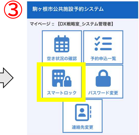
「スマートロック」を押す