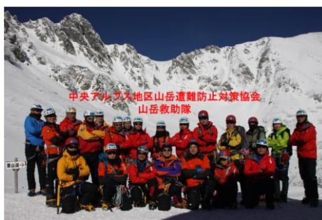
中央アルプス山岳救助隊