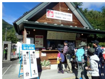
菅の台バスセンター