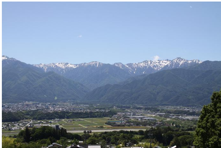
駒ヶ根市街地と中央アルプスの山並み

中央アルプス国定公園や山麓の貴重な自然環境を舞台とした 新たな観光スタイルを作り出す地域おこし協力隊を募集します！