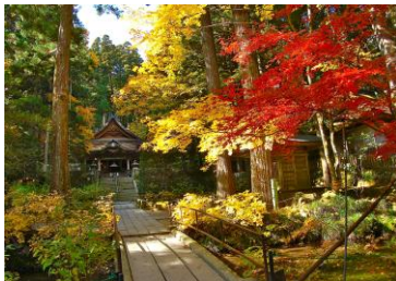
名刹光前寺の紅葉