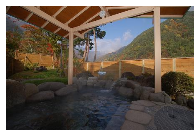
早太郎温泉郷の秋