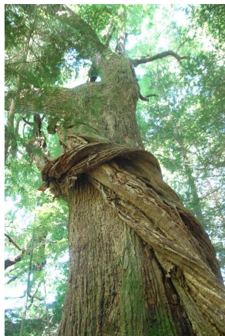
コナラの幹に巻き付くフジ