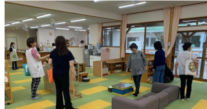
まあるくなあれ♪見学 ＜子育て支援センター長＞