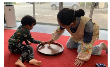
ミニカーを走らせると ぐるぐる回っておもしろいね