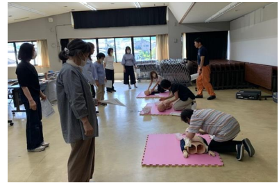
心肺蘇生法 ＜伊南北消防署＞