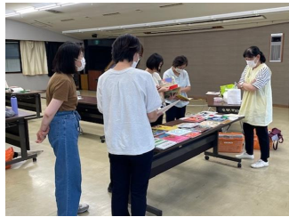
子どもの遊び ＜保育園長＞