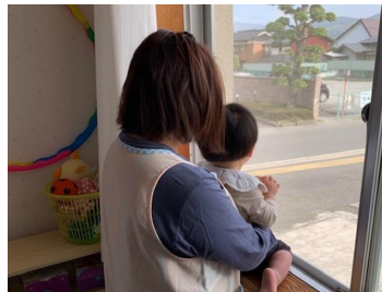
もうすぐお迎えに くるかなあ