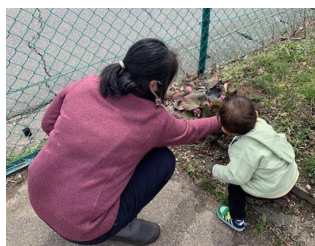
お散歩中に なにか見つけたよ