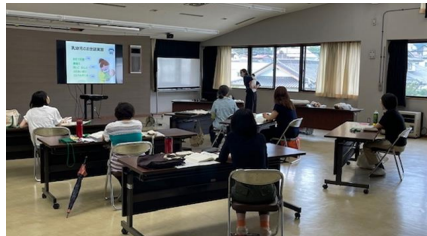
子どもの生活へのケアと援助 ＜助産師＞