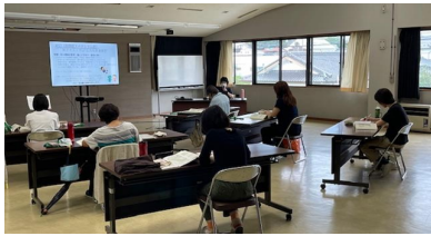
心の発達と保育者のかかわり ＜保育カウンセラー＞