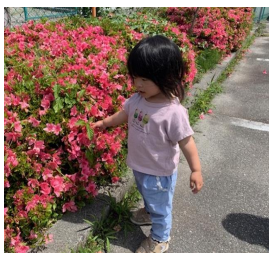
きれいなお花だね