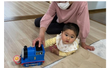
お気に入りのおもちゃで 楽しそうに遊んでいます