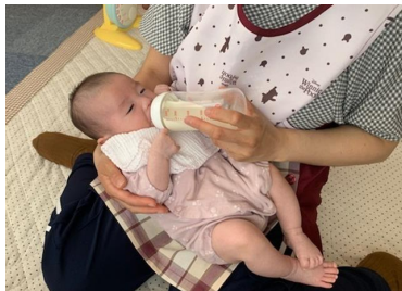
ゴクゴク飲んでいる姿を 見ているだけで癒やされます