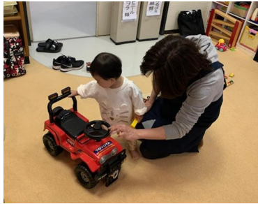
かっこいい車に興味津々です