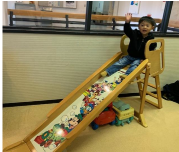
やっほ～ 滑り台は大人気です