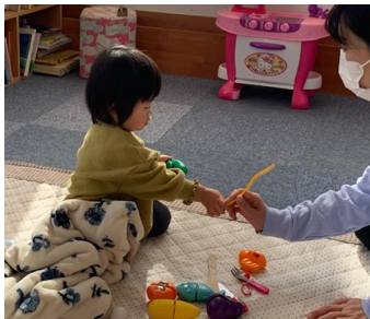
サポーターさんには、どうぞ(^_^)