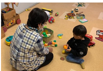
おままと楽しいな 今日は何を作りましょうか？