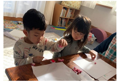
生後4ヶ月からファミサポ利用スタート ただいま4歳、大きくなりました(^^)