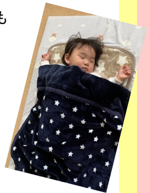
たくさん遊んで、ごはんを食べて スヤスヤお昼寝中です…