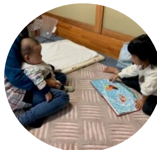
お姉ちゃんが弟くんに 絵本を読んでくれている 微笑ましいようすをバシッリ