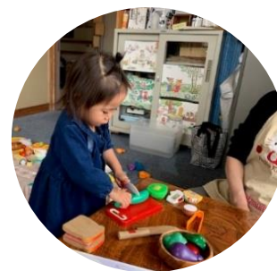
サポーターさんに お料理をつくっています おいしそうですね