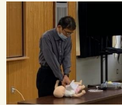
心肺蘇生法 ＜小児科医＞