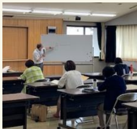
心の発達と保育者のかかわり ＜保育カウンセラー＞