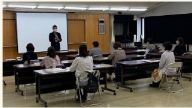
開講式 ＜子ども課長＞

ファミサポはお子さんのお預かりや送迎などに対応しています。どんな理由でも、朝でも夜でも、土日祝日も利用できます。困った時はご連絡ください。あなたの子育て、応援します！