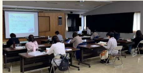
身体の発育と病気 ＜小児科医＞