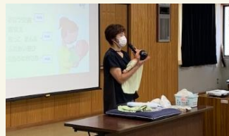
子どもの生活へのケアと援助 ＜助産師＞