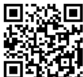
【駒ヶ根市ホームページ】