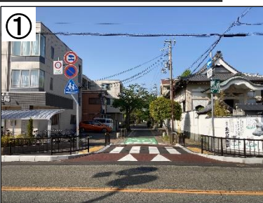
スムーズ横断歩道(イメージ)