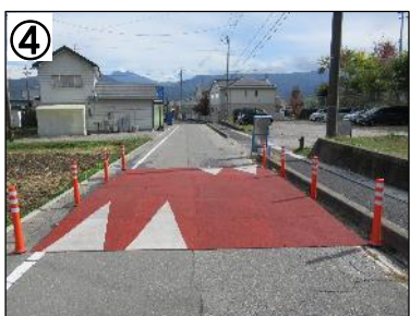
ハンプ(社会実験時)