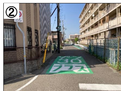
ゾーン30プラス看板・路面表示(イメージ)