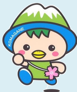
駒ヶ根市PRキャラクター こまかっぱ