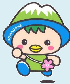
駒ヶ根市PRキャラクター こまかっぱ