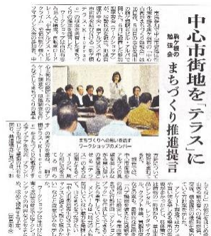
長野日報 (H28. 11. 18) 記事より