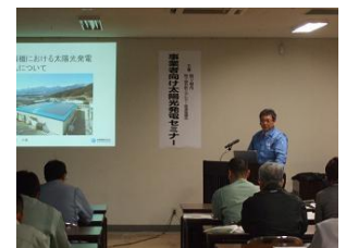
太陽光発電セミナーの様子