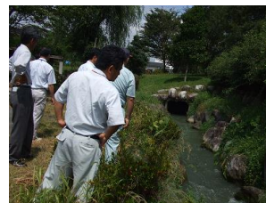
小水力発電適地調査の様子