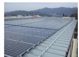
新エネルギー導入促進