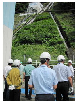
水力発電所の視察