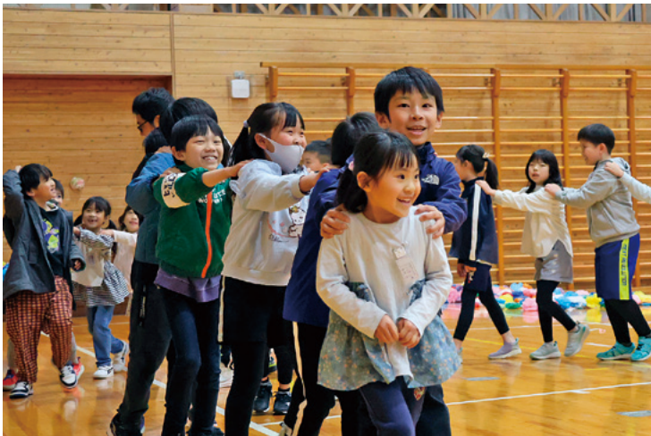
じゃんけん列車でみんなの心を一つに