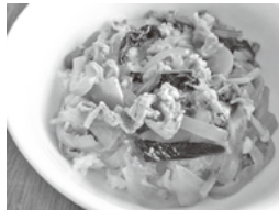
食改で調理した料理