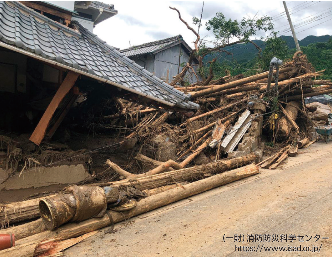
(一財) 消防防災科学センター https://www.isad.or.jp/