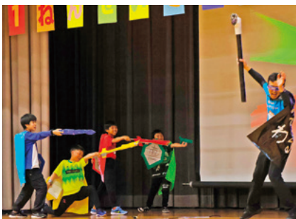
めんどくさ大王をみんなで退治

赤穂南小学校で、1年生を迎える会が行われました。本年度入学した44名の1年生は、6年生と手をつなぎながらうれしそうに入場。児童会による劇で学校の紹介が行われたほか、じゃんけん列車や合唱、手作りメダルのプレゼントなどもあり、全校児童みんなで1年生の仲間入りを喜びました。