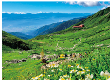
活動場所の一つだった千畳敷カール

地 域おこし協力隊に 着任してから、あ つという間に3年が経ち ました。山と観光、どち らも楽しめる駒ヶ根とい う場所で、自分自身が楽 しみながらその魅力を発 信させていただき、とて も有意義な3年間です た。こんなに充実した時 間を過ごせたのは、関係 各所の皆さんや応援して くださる方々のおかげで す。本当にありがとうございます。