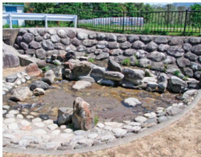
水遊び場もあります