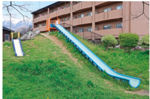
幅広い年齢の子が楽しめる滑り台