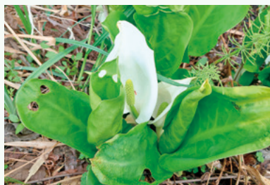
美しく咲くミズバショウ

【1日の食塩目標量】1~2歳男児:3.0g未満、1~2歳女児:2.5g未満、3~5歳:3.5g未満、成人男性:7.5g未満、成人女性:6.5g未満