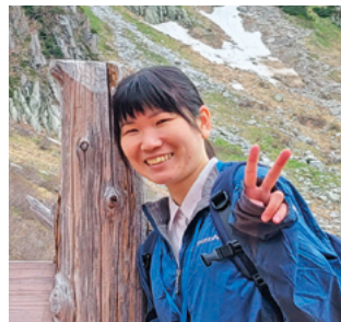
地域おこし協力隊

地 域おこし協力隊に 着任してから、あ つという間に3年が経ち ました。山と観光、どち らも楽しめる駒ヶ根とい う場所で、自分自身が楽 しみながらその魅力を発 信させていただき、とて も有意義な3年間です た。こんなに充実した時 間を過ごせたのは、関係 各所の皆さんや応援して くださる方々のおかげで す。本当にありがとうございます。