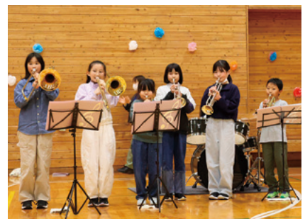
金管バンドの演奏で1年生をお出迎え