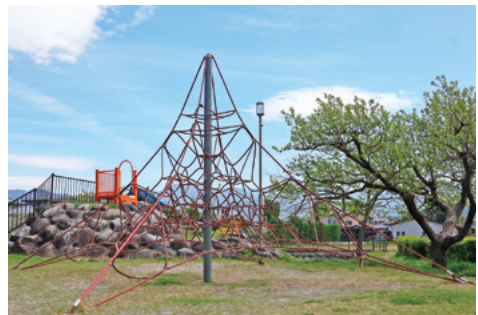
大迫力のザイルクライミング