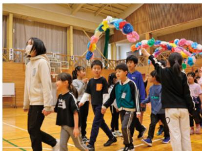
拍手で迎えられ入場