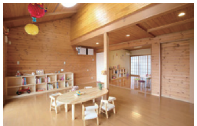
すずらん病児保育室