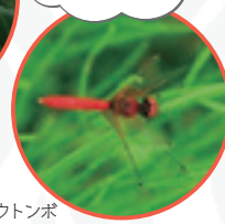
ハッチョウトンボ