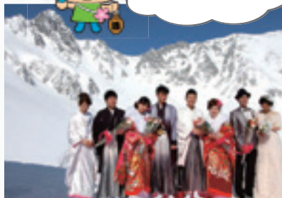
場 千畳敷カール 期 毎年2月第1土曜日 場 駒ヶ根高原『幸せの森』ブライダル協会