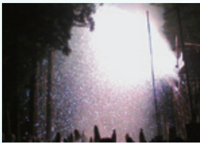
場 大御食神社 9月中旬 ☎83-7606 場 大宮五十鈴神社 9月下旬 ☎81-6881