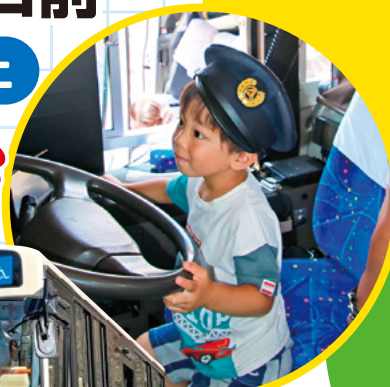
(令和6年開催時の様子)