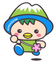
駒ヶ根市PRキャラクター