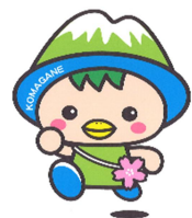
駒ヶ根市PRキャラクター