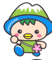
駒ヶ根市PRキャラクター