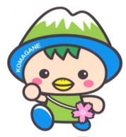
駒ヶ根市PRキャラクター