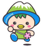
駒ヶ根市PRキャラクター