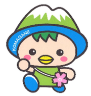
駒ヶ根市PRキャラクター