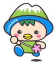
駒ヶ根市PRキャラクター