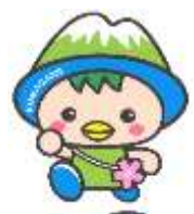
駒ヶ根市PRキャラクター