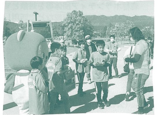
スポーツイベント会場での募金活動