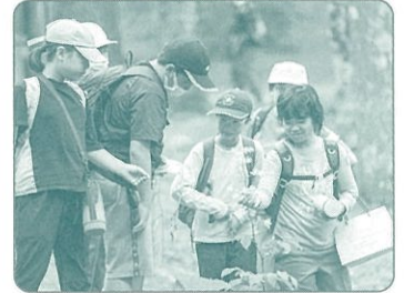
みどりの少年団交流集会