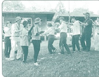
指導者スキルアップ研修会

各地区での身近な緑化活動や、 森林ボランティア団体等を対象とする公募事業、 みどりの少年団の育成などに活用しています。