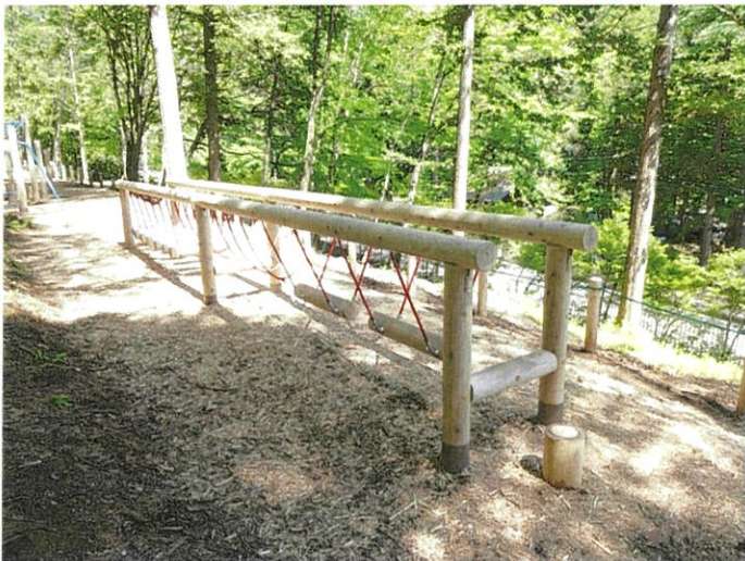
09_森のゆらゆら小道