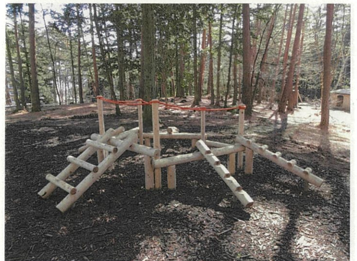
16_かっぱの皿わたり