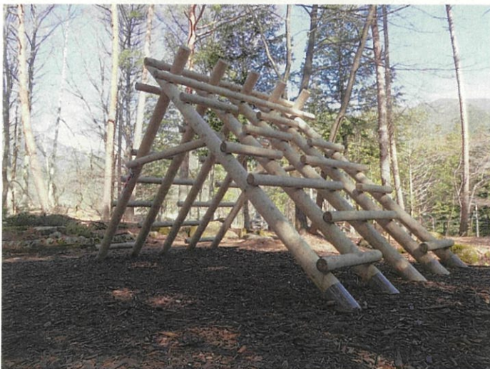
15_こまっ子マウンテン