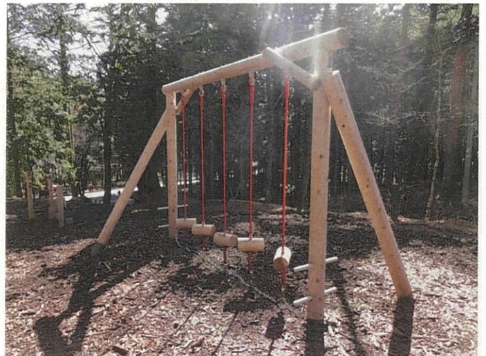
14_ゆれるすずらんわり