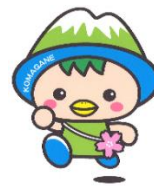
駒ヶ根市PRキャラクター 「こまかっぱ」