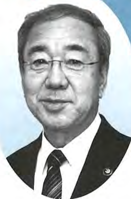
広域連合長 白鳥 孝