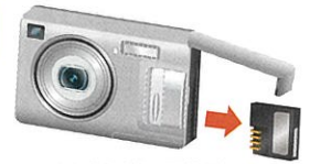
電池を外して分別

〈お問い合わせ先〉お住まいの市町村またはクリーンセンター八乙女 TEL:0265-79-8773まで