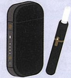
加熱式タバコ・電子タバコ