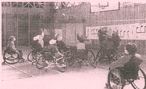
〈ボランティアスクール〉 講師を招いてパラ競技でもある車いすバスケットを体験しました。