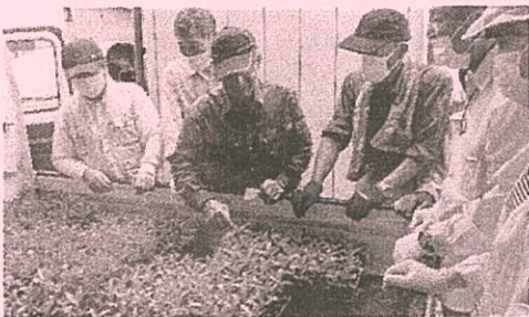
〈ふれあい花壇〉 コロナ禍でしたが、感染対策をしながら多くの地区社協で花壇づくりに参加してくださいました。