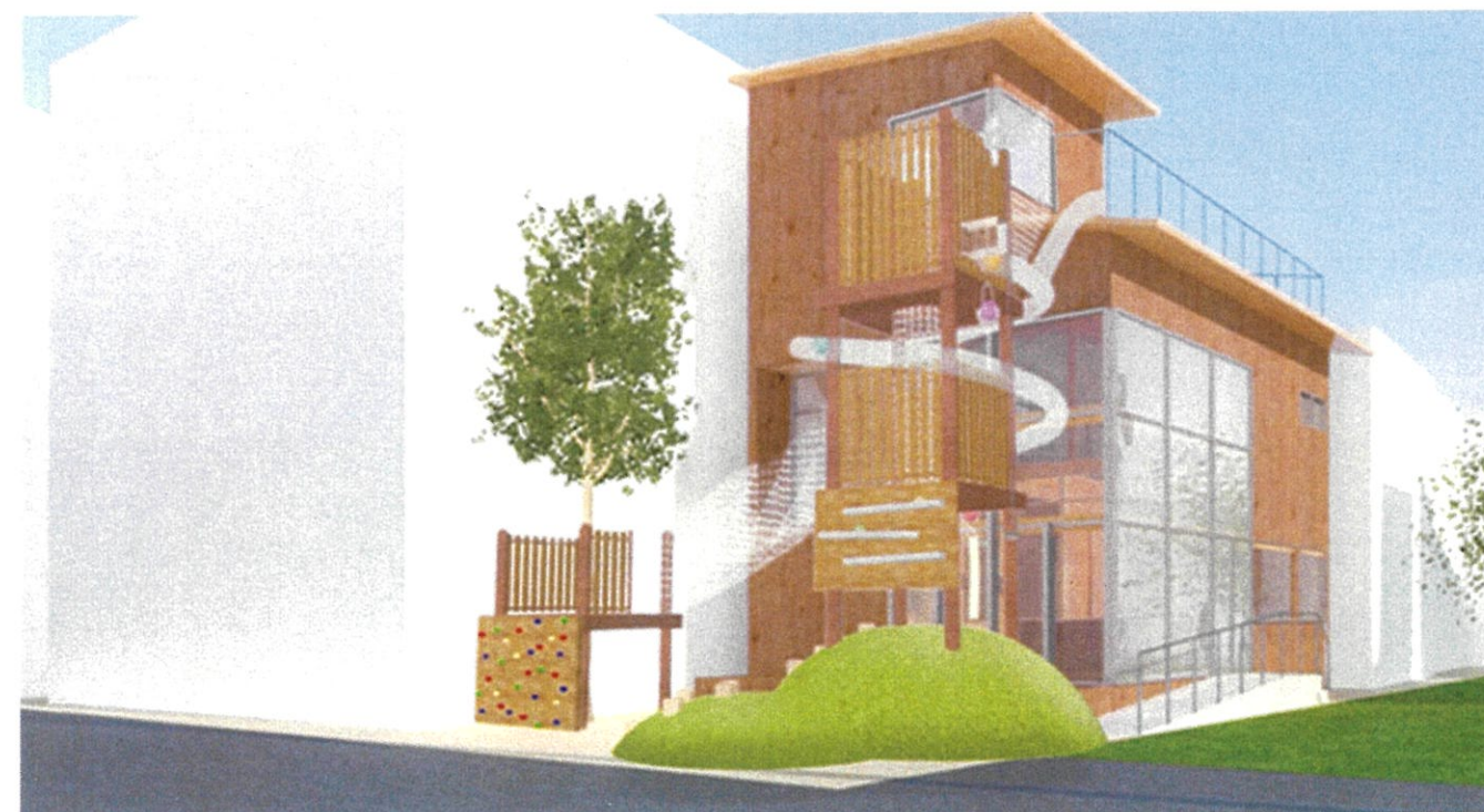
外観パース（南東より望む）