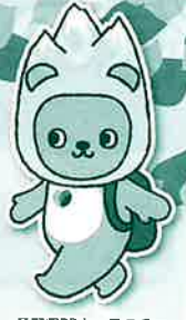
長野県PRキャラクター 「アルクマ」 ©長野県アルクマ