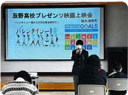
映画上映会：SDGsについて考える 辰野高校