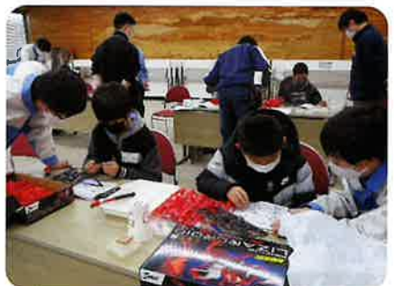
子ども工作教室：先生は高校生 駒ヶ根工業高校