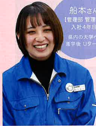
船本さん 【管理課 管理課長】 入社4年目 県内の大学へ進学後 Uターン