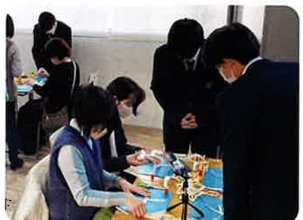
ワークショップ：地元の経木を活用 上伊那農業高校