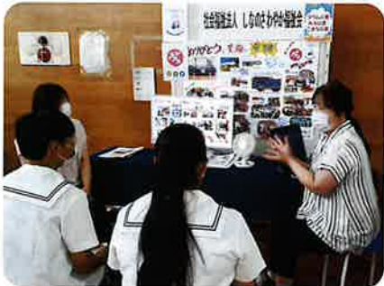
キャリアフェス：地元企業を知る 伊那西高校