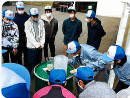
フィールドワーク：産業技術を見学 伊那北高校