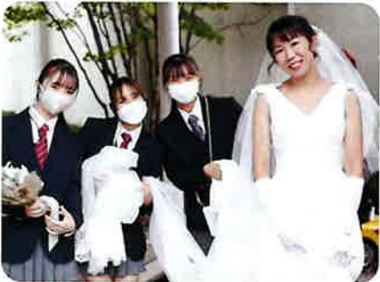
やっちゃんブライダル：プランナー体験 赤穂高校