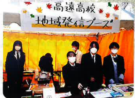
商品開発：もみじ祭りで販売 高遠高校