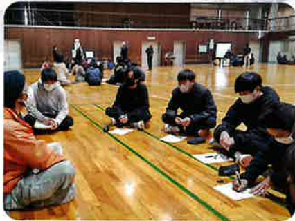
キャリアデザイン：地域の大人と語る会 箕輪進修高校

上伊那の各高校では、さまざまな授業で、地域をフィールドにした学びが展開されています。また、授業で学んだことを生かして、自分たちで地域の方々と共に活動を生み出す姿もあります。地域に飛び出して、「地域の人に出会う」「地域を知る・地域を考える・地域を語る」という体験を通した学びは、自分らしい生き方の実現につながると考えます。