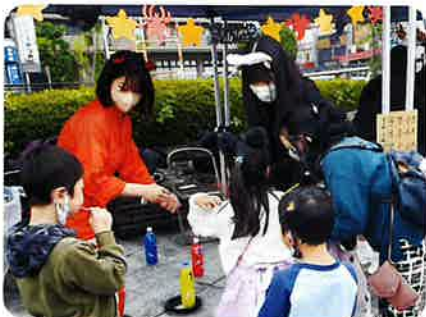
ハロフェス：地域の活性化を考える 伊那弥生ヶ丘高校