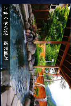
こまくさの湯 露天風呂